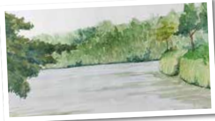
Aquarell von Sarah Grafe: Talsperre Krieb- stein

Weiter geht es mit der Gestaltung unserer Werke vom Mal- wochenende in Kriebstein – dabei kommen unterschiedliche Materialien und Techniken zum Einsatz.