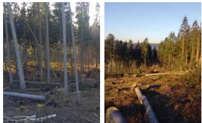
Waldzustand nach Borkenkäferbefall sowie anschließender Schadholzernte im Kommunalwald Borstendorf

In unserem Kommunalwald in Waldkirchen werden wir voraussichtlich gemeinsam mit der „Stiftung Wald für Sachsen“ ein Aufforstungsprojekt umsetzen. Über diese Kooperation freue ich mich ganz besonders und werde Sie darüber im Laufe des Frühjahrs auf dem Laufenden halten.