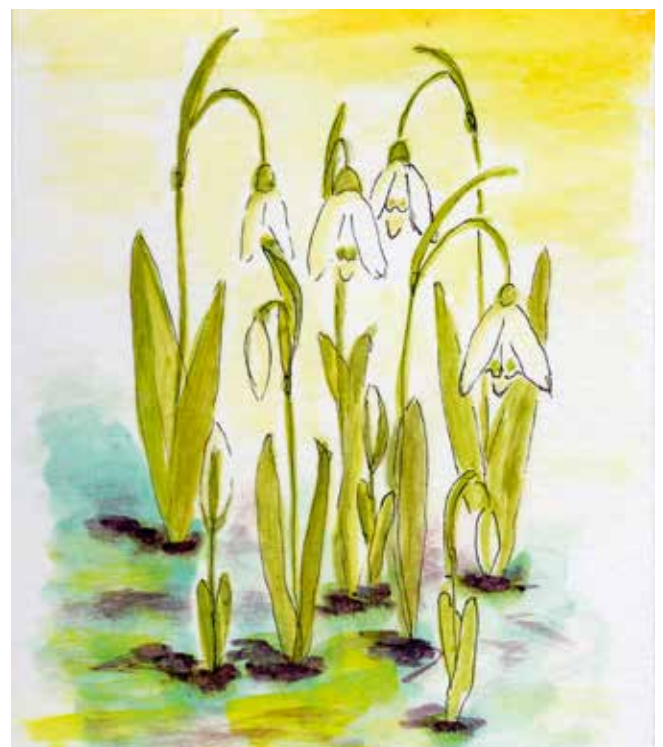
Aquarell von Agnes Schönherr