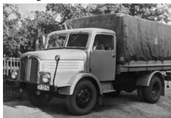
S4000 von Gerhard Schubert.

Als Schubert 1972 im Alter von 42 Jahren bei einem Unfall ums Leben gekommen war, wurde der Fuhrbetrieb eingestellt.