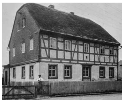
Das Haus Börnichener Straße 13 vor 1914.