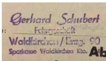
Firmenstempel des Fuhrgeschäfts.