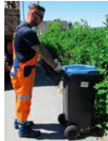
Ihr Müllwerker sagt „Danke.“