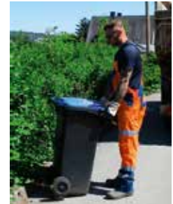
So bitte nicht.