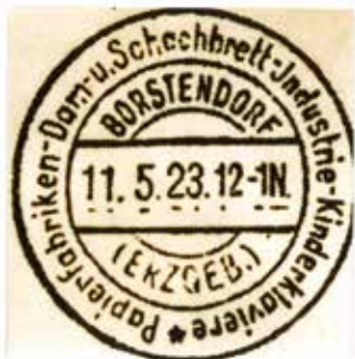
Borstendorf 1 – Ortswerbbestempel 1923, der 1. Schachsonderstempel der Welt