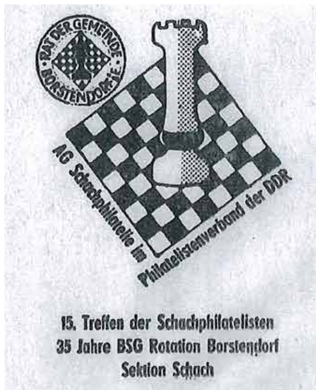
Amtlicher Sonderumschlag "15. Treffen der Schachphilatelisten/ 35 Jahre BSG Rotation Borstendorf"