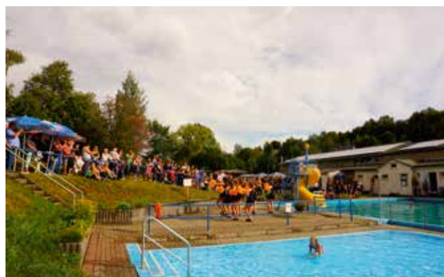
Kinder- und Jugendaktionstag 2020 im Freibad der Gemeinde