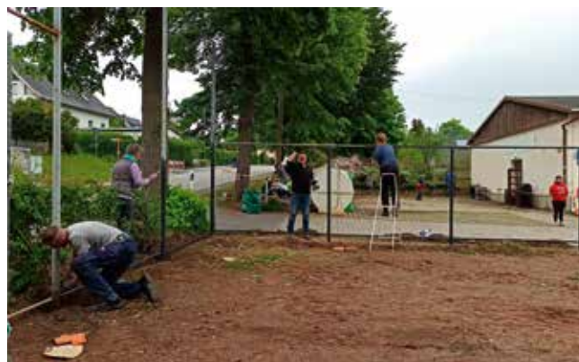
Gelungener Arbeitseinsatz am Sportareal in Waldkirchen