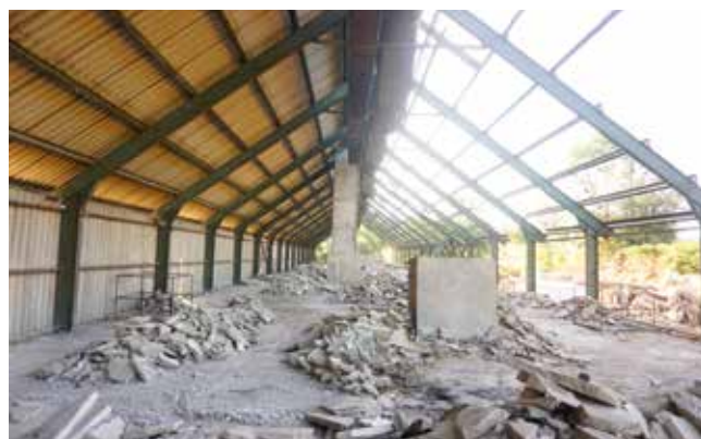
Abriss des alten Kuhstalls in Grünhainichen