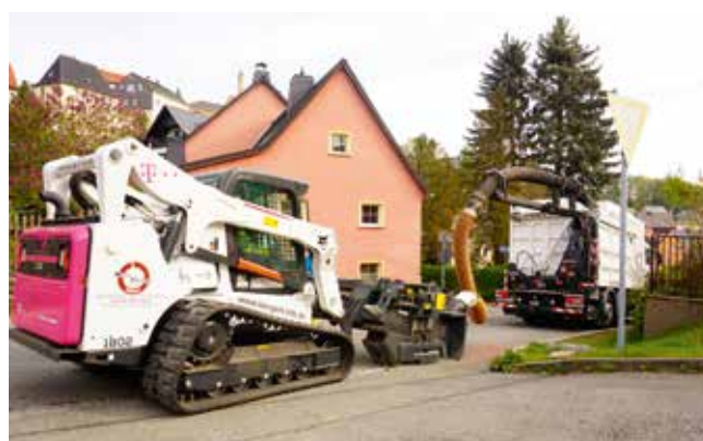
Breitbandausbau in Grünhainichen in vollem Gange